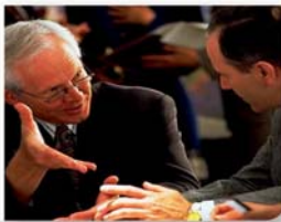
TRADUCCIÓN LEGALMENTE CERTIFICADA

En caso de que el demandado, ya sea por una acción de nulidad de un registro o de infracción, no pueda exhibir las pruebas al momento de contestar la demanda, por encontrarse éstas en el extranjero, se otorgará un plazo adicional de 15 días para su presentación, siempre y cuando sean ofrecidas en el escrito de contestación y se haga el señalamiento respectivo.