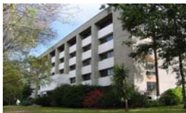
Instituto Mexicano de la Propiedad Industrial

En el caso de las promociones remitidas por correo certificado, servicio de mensajería u otros equivalentes, se tendrán por recibidas en la fecha que efectivamente sean entregadas al Instituto.