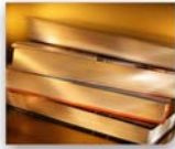
Código de Procedimientos Civiles

No. De acuerdo al art. 192 de la Ley de la Propiedad Industrial, no se admitirán la testimonial y confesional, salvo que el testimonio o la confesión estén contenidas en documental.