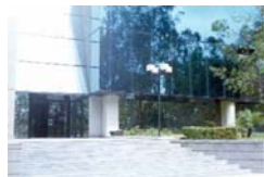
Delegación o Subdelegación

X. ¿Qué pasa si quien promueve una acción de las descritas anteriormente ofrece como prueba una visita de inspección señalando varios domicilios y únicamente hace el pago de la tarifa por una sola visita?